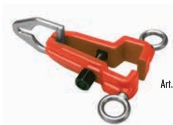
Art. 140 Pinza Pull clamp