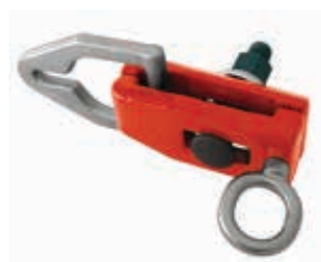
Art. 145 Morsetto piatto Flat clamp