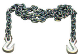
Art. 3002S | Catene di tiro Pull chains