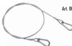
Art. 80 | Cavo di sicurezza Safety cable

Il cavo di sicurezza è fortemente raccomandato unitamente all'utilizzo di ogni tipo di morsetto e gancio di tiro. The use of the safety cable is strongly recommended together with all pull clamps and hooks.