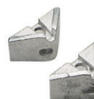
Art. 204 | Coppia angolari di tiro Pair of angle pieces

Example of use with pull clamp item 202 (optional).