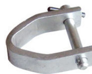
Art. 96 | Staffa di tiro Pull yoke

Ambedue gli articoli possono essere utilizzati al posto del galfare di tiro Both references can be used in substitution of the pull eye