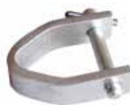
Art. 96 | Staffa di tiro Pull yoke

Ambedue gli articoli possono essere utilizzati al posto del galfare di tiro Both references can be used in substitution of the pull eye