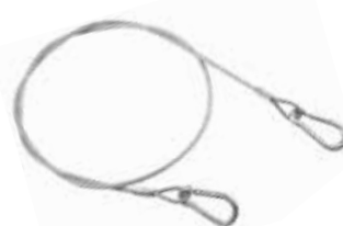
Art. 80 | Cavo di sicurezza Safety cable

Il cavo di sicurezza è fortemente raccomandato unitamente all'utilizzo di ogni tipo di morsetto e gancio di tiro. The use of the safety cable is strongly recommended together with all pull clamps and hooks.