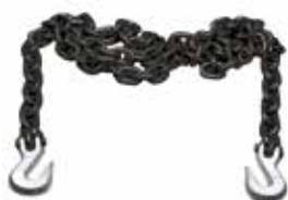
Art. 3002S | Catene di tiro Pull chains